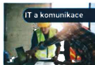
IT a komunikace