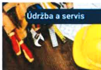
Údržba a servis