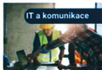
IT a komunikace