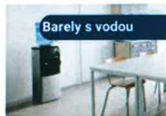
Barely s vodou