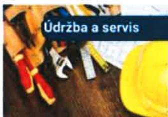
Údržba a servis